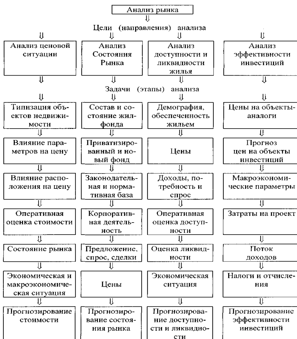
Рис. 1. Структура целей и этапов анализа рынка недвижимости