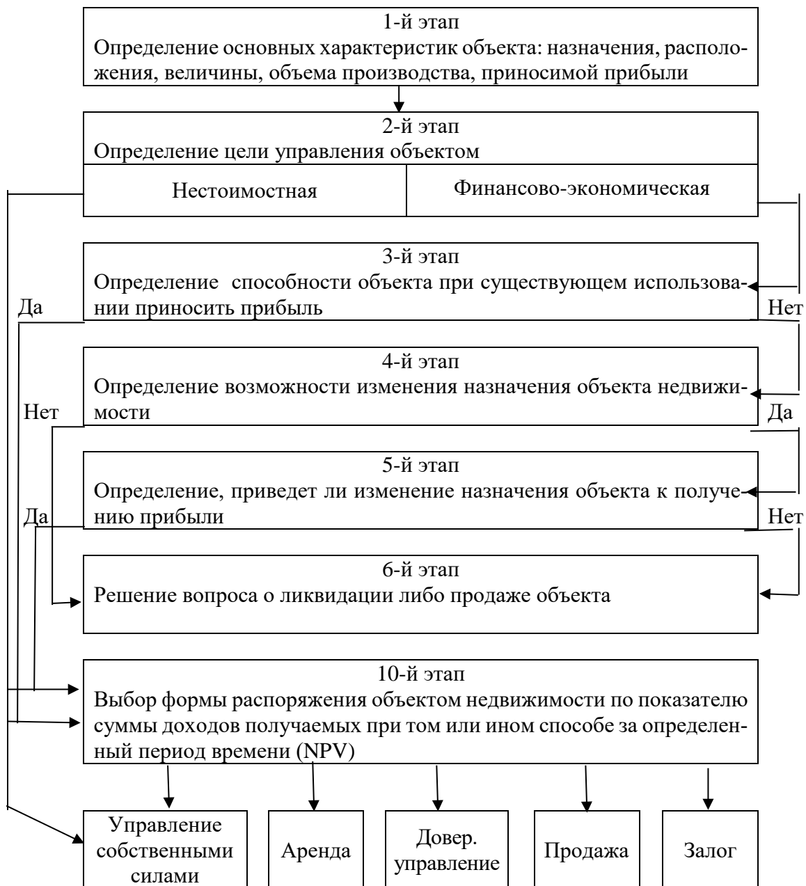
Рис. 2. Методика определения формы распоряжения объектом